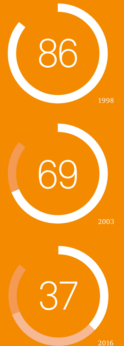
FÜHRUNGSKRÄFTE IN DEUTSCHLAND, DIE IHREN FÜHRUNGSSTIL ALS KOOPERATIV/DEMOKRATISCH BESCHREIBEN WÜRDEN (ANGABEN IN PROZENT)