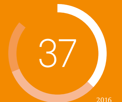
FÜHRUNGSKRÄFTE IN DEUTSCHLAND, DIE IHREN FÜHRUNGSSTIL ALS KOOPERATIV/DEMOKRATISCH BESCHREIBEN WÜRDEN (ANGABEN IN PROZENT)